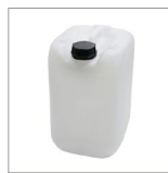
COD0407 Tanica 20 lt