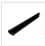
CVON (X3) Prolunga tubo 44 cm