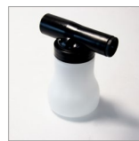
CVK53 Nebulizzatore per prodotti alcolici