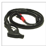
CVP5 Impugnatura 5 mt