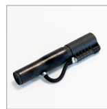
CVK535 Nebulizzatore per impugnatura